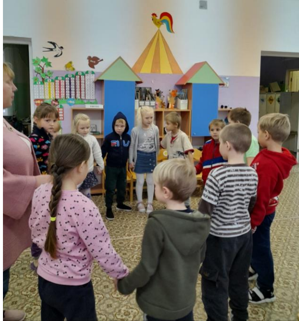
Вручены буклеты «Родителям об экономическом воспитании детей» в группе от 5 до 7 лет «АБВГДейка»