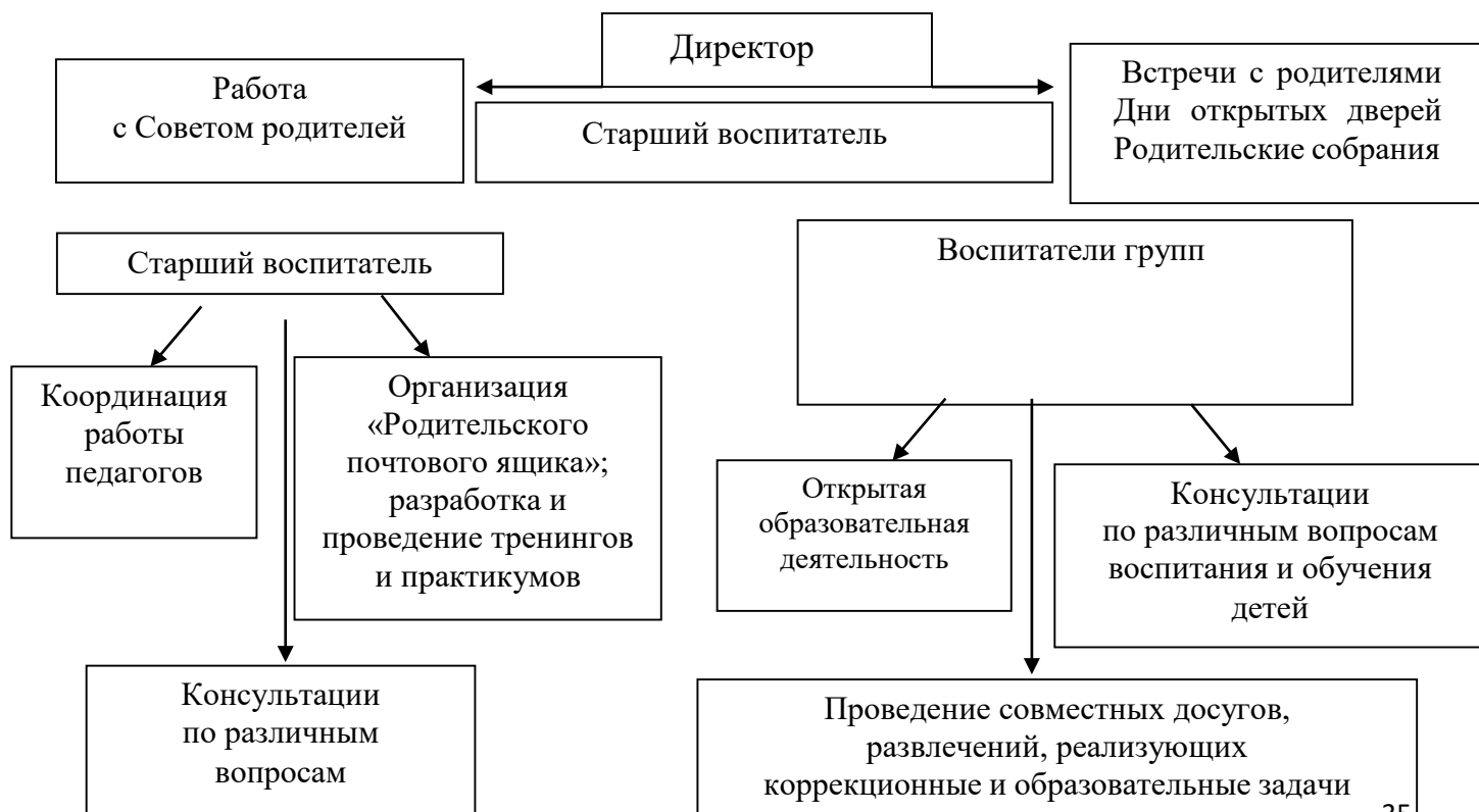
Схема взаимодействия с семьями воспитанников